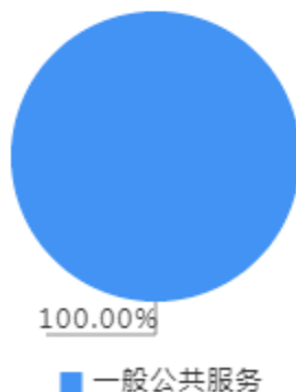
一般公共预算财政拨款支出决算结构图

2022年度一般公共预算财政拨款支出829.40万元，主要用于以下方面：一般公共服务（类）支出829.40万元，占100.00%。