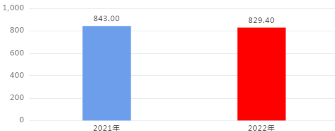
财政拨款收、支决算总计变动情况图（单位：万元）

2022年度财政拨款收、支总计829.40万元。与2021年度相比，财政拨款收、支总计各减少13.60万元，下降1.61%。主要是市场监管领域食品安全监督抽检经费减少。