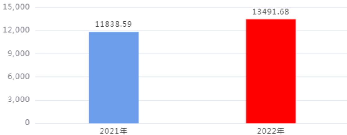
收、支决算总计变动情况图（单位：万元）

2022年度收、支总计13,491.68万元。与2021年度相比，收、支总计各增加1,653.09万元，增长13.96%。主要是经营收、支增加。